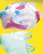
Plastikbeutel und Plastikfolie