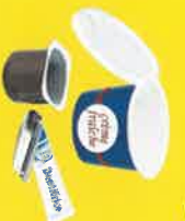
Plastikbecher und Tube